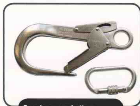
Gancio e moschettone.