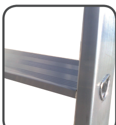
Gradino piano 80 mm